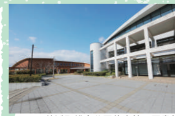
美浜町総合公園体育館・図書館