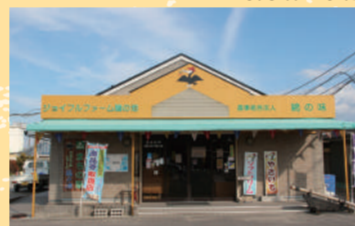
ジョイフルファーム鷗の池