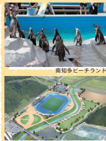
運動公園イメージ図