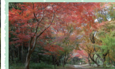
オレンジラインハイキングコース